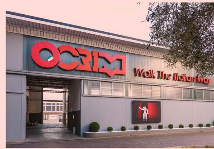
A fianco, la storica sede Ocrim di Via Massarotti

ne di sistemi di stoccaggio che garantiscono la conservazione ottimale delle materie prime e dei prodotti finiti. L'integrazione delle competenze di Sima - presente nel settore dal 1980 - consente a Ocrim di rafforzare sul mercato la propria offerta di soluzioni complete, grazie a una quasi totale internalizzazione delle lavorazioni. Questa mossa strategica ha portato Ocrim a essere un interlocutore indiscusso nella fornitura di soluzioni end-to-end per l'industria molitoria globale.