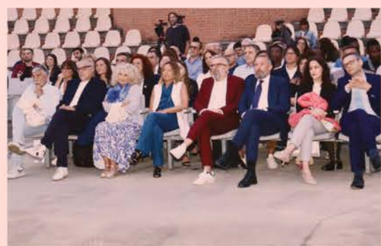
Parte del pubblico presente all'Arena Giardino

La serata di mercoledì 3 luglio ha fornito l'occasione per presentare ufficialmente un grande progetto di inclusione sociale: