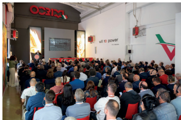
Sala convegni - Conference room