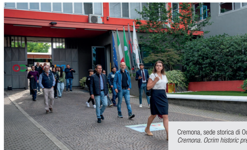
Cremona, sede storica di Ocrim - Grano farina e... 2024 Cremona, Ocrim historic premises – Grano, farina e... 2024