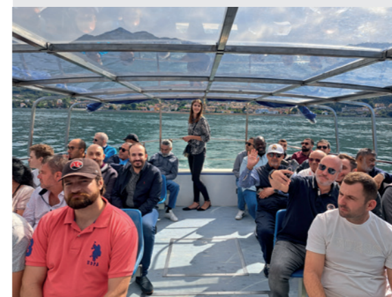
Cremona, sede storica di Ocrim - Grano farina e... 2024_cena e musica dal vivo + Gita al Lago d'Iseo Cremona, Ocrim historic premises – Wheat, flour and... 2024 – dinner and live music + Trip to Iseo Lake

The “Wheat, flour and...” 2024 event represented a perfect synthesis of innovation, tradition and valorization of human capital. With a program rich in content, which was able to combine moments of technical discussion and reflection on global changes, Ocrim confirmed its role as a leader in the milling and agri-food sector, looking confidently to the future and to the goal of its eightieth anniversary in 2025.