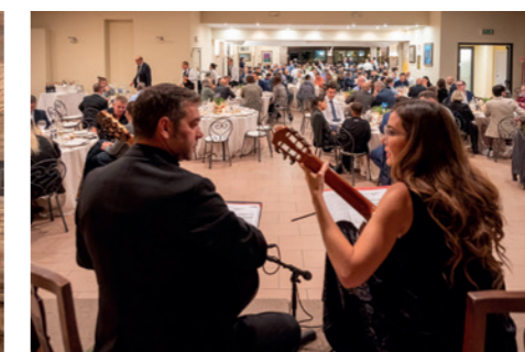
Polesine Parmense: visita cantine culatello e parmigiano presso Corte Pallavicina Cena di gala al Cavallino Bianco