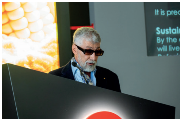
President Sergio Antolini

On 13 and 14 September 2024, Ocrim organised the annual “Wheat, Flour and...”, an event that has become unmissable for the milling and agri-food industry. This event was attended by over 250 people, welcomed into the company's renovated conference room in Cremona, with presentations ranging from technological evolution, with a focus on artificial intelligence (AI), to topics of sustainability and agricultural innovation. The programme, divided into two days, highlighted Ocrim's role not only as a top-player in the milling sector, but also as a point of reference for an ethical and sustainable approach in the agri-food world.